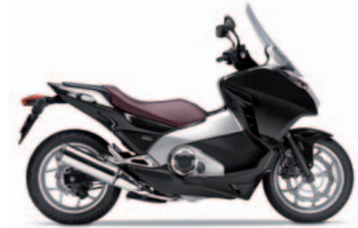
Pearl Cosmic Black