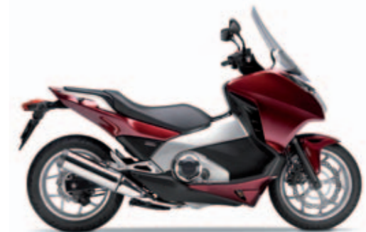
Candy Graceful Red