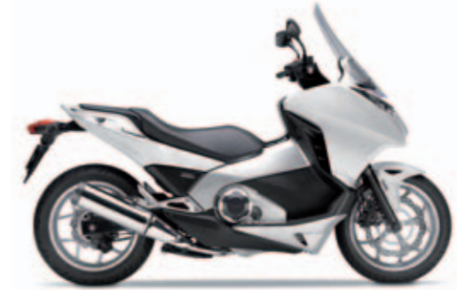
Pearl Sunbeam White