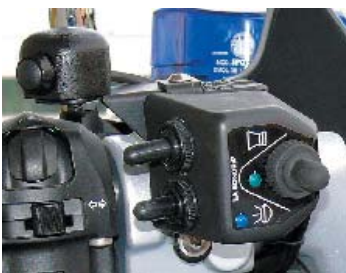
Sendetaste Funk Bedieneinheit SSA