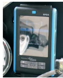
Funkbedieneinheit (Rugged PDA)